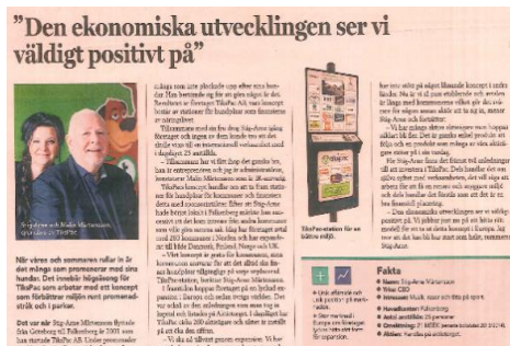
Stockpickers (Bilaga DI) april 2015