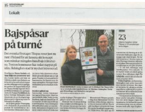
HBL Helsingfors april 2015