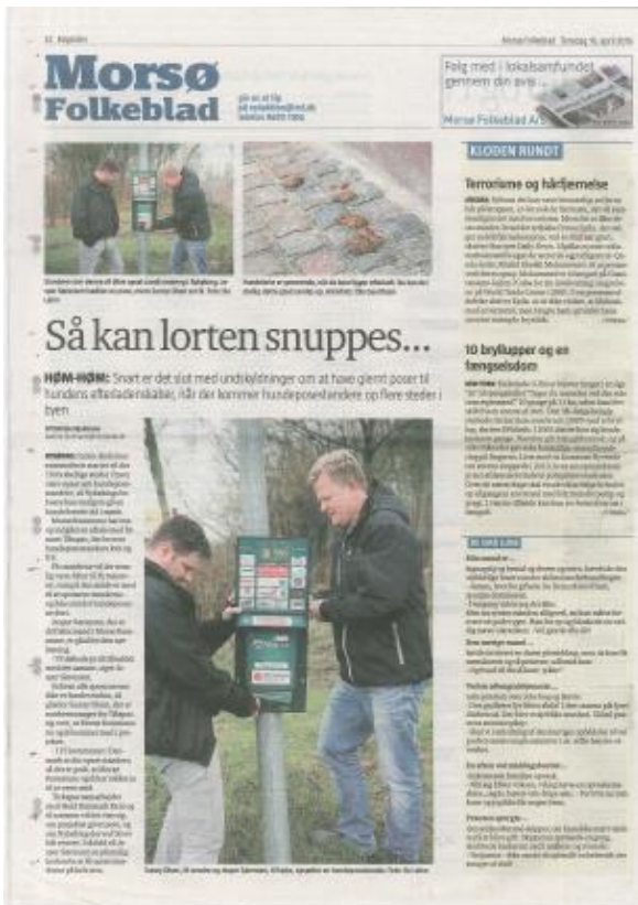
Artikel i danska Morsø Folkeblad april 2015